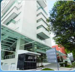
Hospital São Camilo de São Paulo